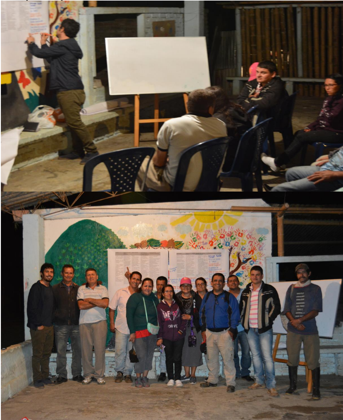
Registro fotográfico Municipio de Trujillo. Enero 15 – 17 de 2017.